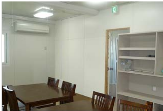
施工前の単身棟内部