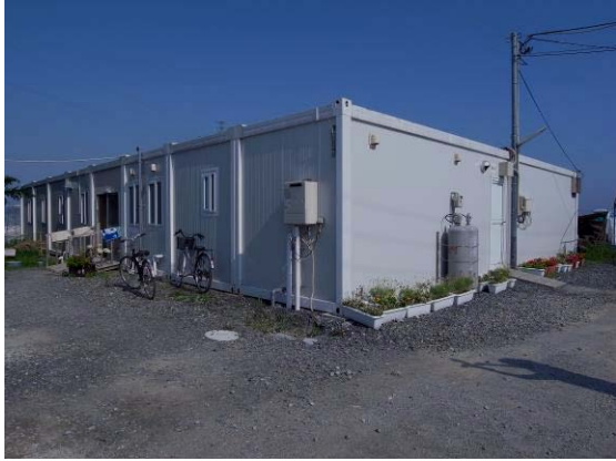
施工前の単身棟外壁