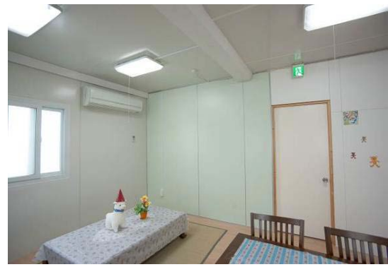
施工後の単身棟内部

アンケートは仮設住宅の居住者と周辺住民の方々約 30-50 名の協力のもと、施工前および施工完了 1 ヶ月後の 2 回、実施しました。既存の白い外壁に癒し効果の期待されるカラー鋼板を施工したことで、下図で示されるように、どの項目に際してもポジティブな印象への変化が見られ、癒し効果の期待される色彩が居住者の感情状態及び周辺住民の印象評価にポジティブな影響を与えていることが確認できました。