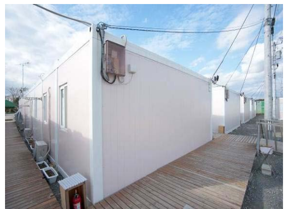
施工前の家族棟外壁