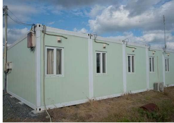
施工後の単身棟外壁