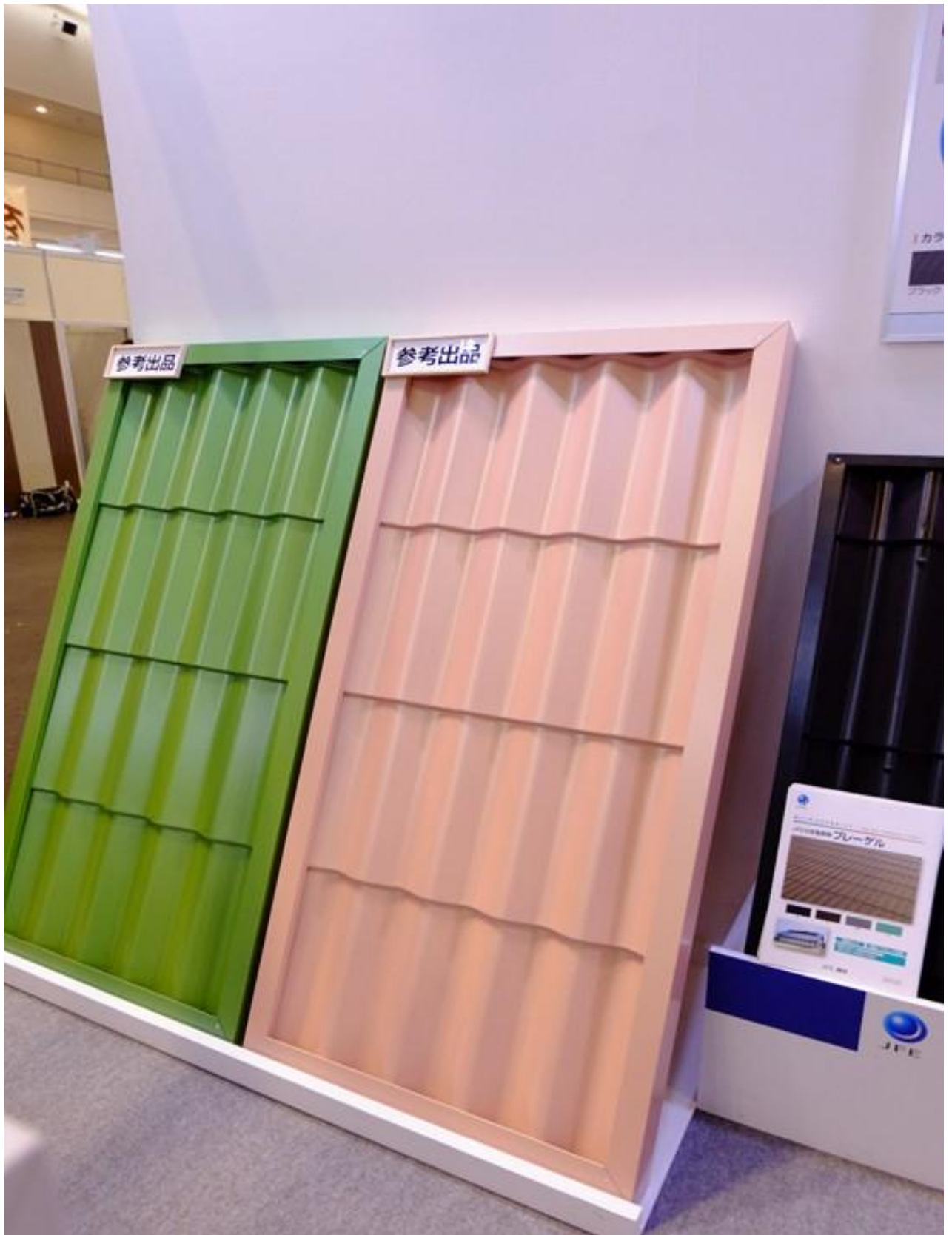
第68回全国建築板金業者京都大会に出展した 『なでしこ』ルーフ